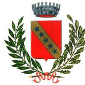
Comune di Remanzacco