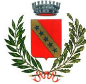
Comune di Remanzacco