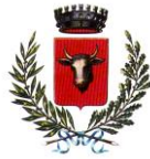
Comune di Manzano